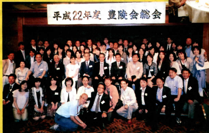
平成22年度 豊陵会総会