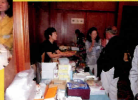
お楽しみオークション