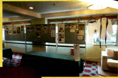
豊陵資料室 ミニ出張展示