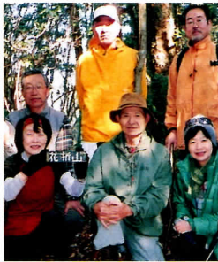
豊陵山歩にて(前列中央)

学校正面玄関を入ったところの事務室横に大きな木箱が置いてあって、指定の日に銘々が授業料の入った袋を入れてゆく。人氣は全くない。