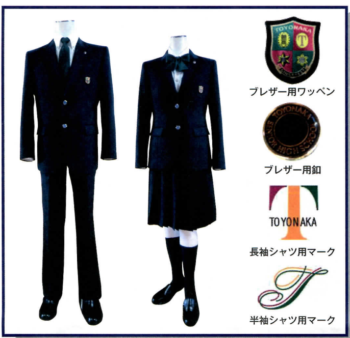
プレーザ用ワッペン プレーザ用釦 長袖シャツ用マーク 半袖シャツ用マーク

す」と話すなど、「制服決定」のニュースは卒業生の間でも、期待と関心が高まりそう。(制服変遷の経緯は、創立80周年記念誌及び豊陵会名簿2008より)